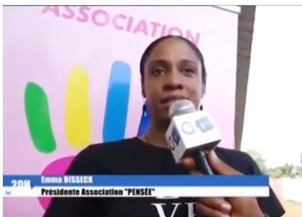
Campagne de parrainage locale pour la prise en charge des enfants de l'orphelinat