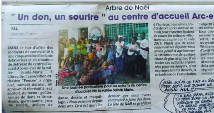
Arbre de Noël pour les enfants du centre Arc-en_ciel

Remise de dons pour les enfants incarcérés