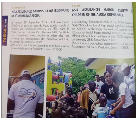
Don et remise de kits scolaires pour les enfants AEODA en partenariat avec l'entreprise NSIA assurances