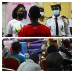
L'association "PENSÉE" remettant les dons aux mineurs de la prison centrale

par Richard Nkanga WBF Info - 19 Dec 2021, 11:53 0 Commentaires