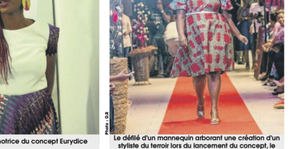
Défilé d'un mannequin arborant une création d'un styliste du territoire lors du lancement du concept, le samedi 6 mai.

«C'est un projet de longue haleine. Je suis convaincue que ce projet va réussir. Je suis convaincue que ce projet va réussir. Je suis convaincue que ce projet va réussir.